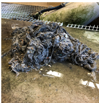
Rensning på Torekovs reningsverk.

Dessutom riskerar du som spolrar ner våt- och städservetter i avloppet, att det blir stopp hos dig. Det kan leda till kostsamma översvämningar för dig när avloppsvattnet trycks tillbaka in i din bostad.