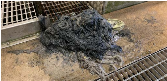
Daglig skörd av skräp i ett av NSVAs reningsverk.

Avloppsrening är en viktig funktion som förhindrar smittspridning och motverkar övergödning. Men för att systemen ska fungera är det viktigt att bara spola ner toalettpapper och det som kommer ur kroppen. Tyvärr orsakar stopp fortfarande stora problem för NSVA och våra tekniker får dagligen åka ut och åtgärda dem.