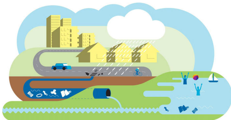
Illustration: Erik Nylund